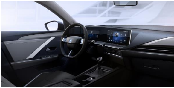
EDITION – X4FX