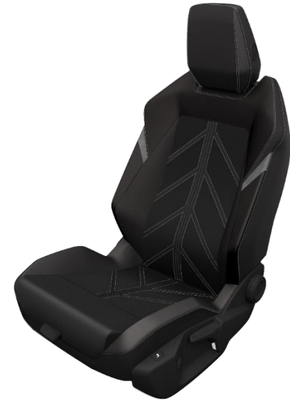
GS LINE & ULTIMATE – 8CFX