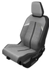
ULTIMATE – X7FX