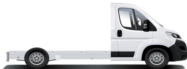
L2S - Passo 3800mm