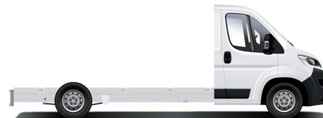
Sbalzo - 1325mm