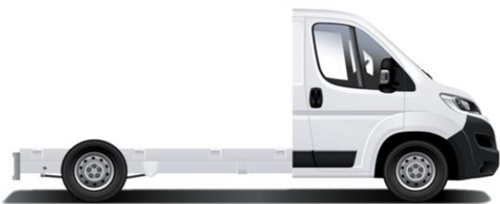
L2 - Passo 3450mm