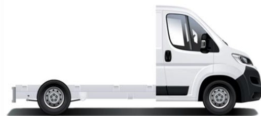
L1 - Passo 3000mm