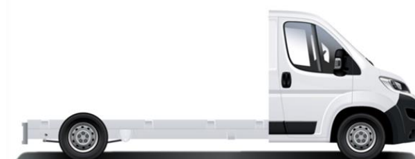
Sbalzo - 960mm